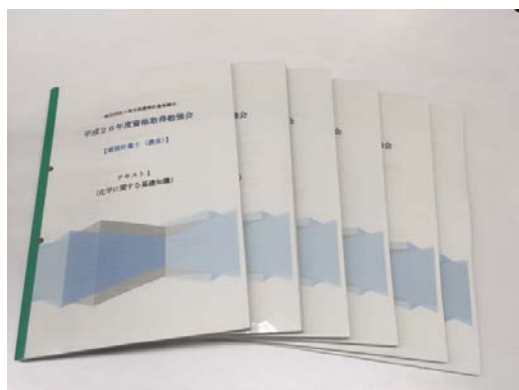
オリジナルテキスト

平成29年度は、過去3年と同様に「環境計量士（濃度）」を対象に資格試験勉強会を開催しますので、是非ともご参加ください。